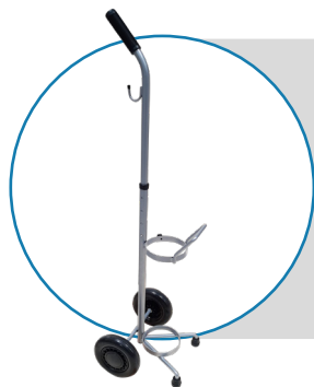
Carrito con altura ajustable y dos ruedas de alta calidad.