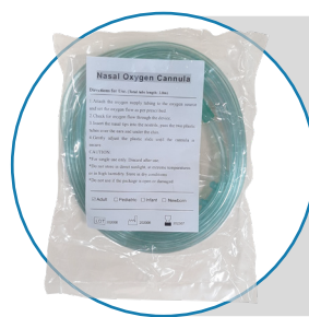
Canula Nasal con diámetro de 2.0 mm.