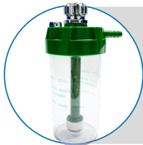
Vaso humidificador con capacidad de 350 cc.