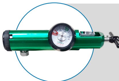
Regulador con medidor de presión.