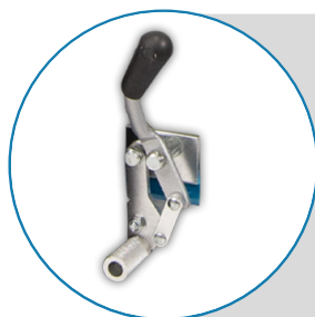
Palanca de bloqueo para ruedas.