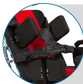
Cojines laterales acojinados.