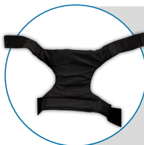
Arnes reclinable de 90° hasta 160°.